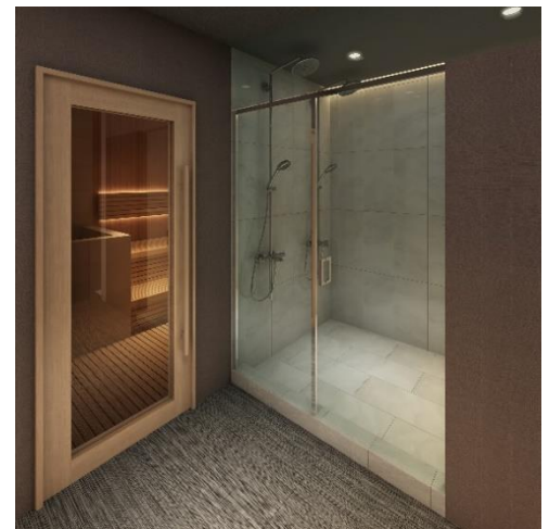
▲プライベート（貸切）サウナ