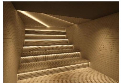
▲パブリックサウナ