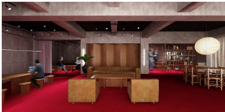
コワーキングスペース